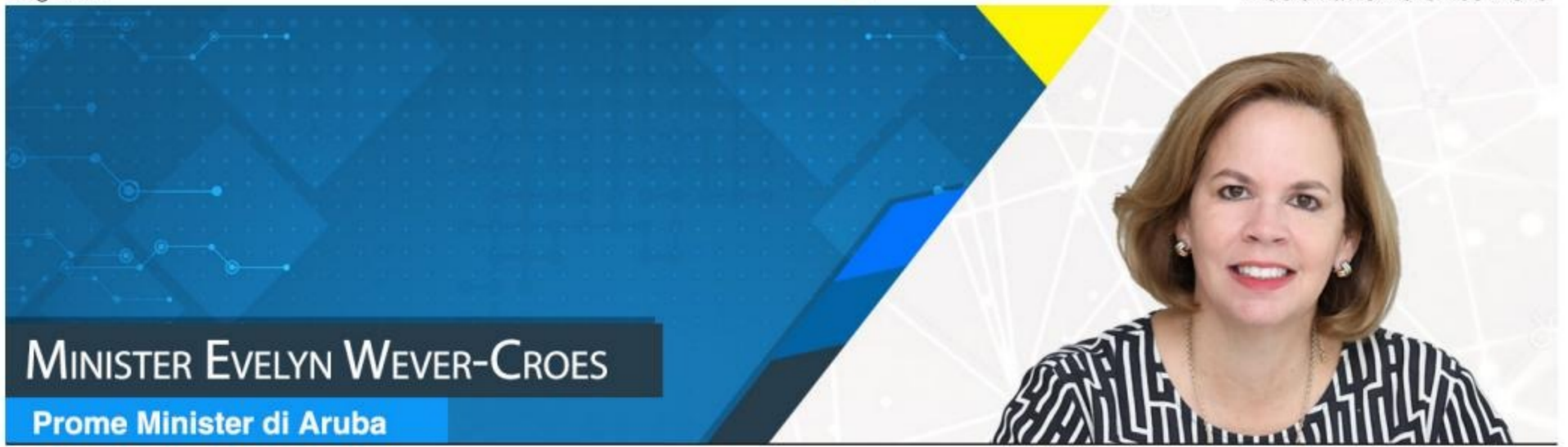
MINISTER EVELYN WEVER-CROES Prome Minister di Aruba